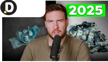
Primo Rico: Quais os melhores investimentos para 2025?